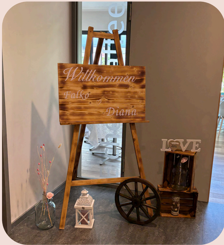
Großes Willkommensschild & Staffellei 20 €